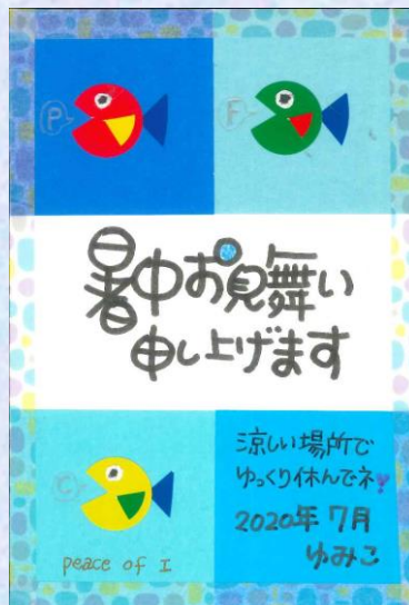
【丸シールとマスキングテープのクラフトはがき(魚)】