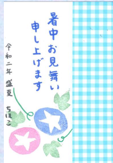
【消しゴムはんこ(朝顔)を用いたクラフトはがき】