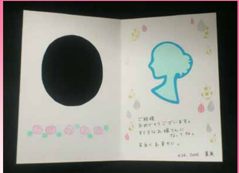
カードを開いた状態