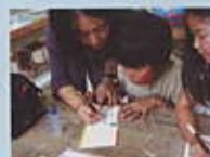
ルールに気をつけて