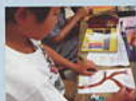
相手が楽しめるように

札幌市立手稲宮丘小学校(開放図書館アカゲラの森)で みんなでチャレンジしてみたよ!!