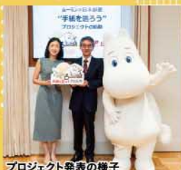
プロジェクト発表の様子

日本郵便株式会社は、2026年6月2日(火)から、日本国内 における「ムーミン」のライセンスを管理する株式会社ライ ツ・アンド・ブランドズのコラボレーションによる「ムーミン ×日本郵便『手紙を送ろう』プロジェクト」を開始しました。