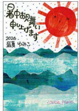
クラフトはがき 福岡県 安河内由美子