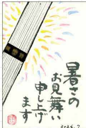
クラフトはがき 新潟県 大橋美千代