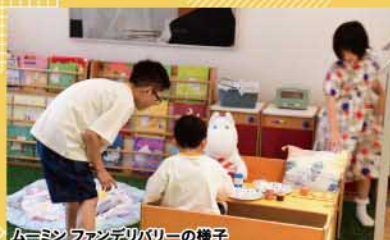
ムーミンファンファミリーの様子