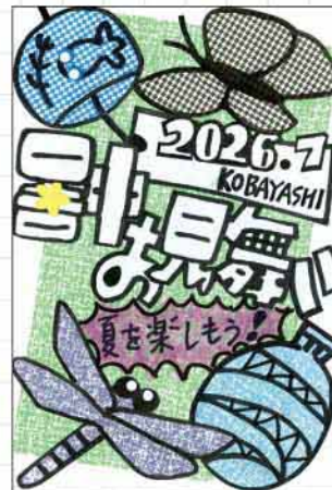
クラフトはがき 兵庫県 小林ますみ