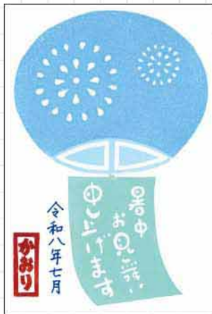
消しゴムはんこ 山口県 丸口かおり