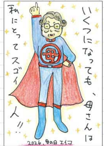
絵てがみ 福岡県 下野えいこ