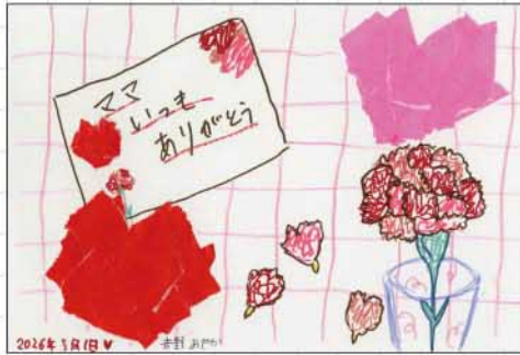
クラフトはがき 和歌山県 吉野絢香