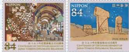
Grand Bazaar (左) とギョベクリ・テペ(右)。

ギョベクリ・テペは今回切手制作を通して初めて知りました。一説では紀元前8000年以上前の構造物もあるとのことで、とても興味深い遺跡です。太古から現代まで、歴史を知れば知るほどトルコの魅力を改めて感じます。