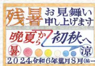
絵てがみ 和歌山県 中川祐一