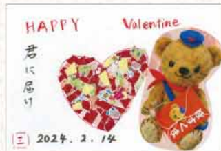
クラフトはがき 愛媛県 河上みな