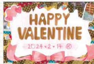
クラフトはがき 滋賀県 武川小春(中学生)