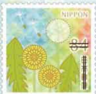
円形のタンポポと七宝模様の組み合わせ。

貝淵 行事の多い「春」に向けて発行するこの切手は、多くの方々にご利用いただいていますので、これまでのイメージを壊さないようにと思い、当初「春の草花の水彩画」を進めることを考えました。ですが、花を題材とした切手については似通わないようにと皆で決めたことと、2月発行の切手が1件であることから、より多くの場面で使いやすいように、少し落ち着いたデザインを意識して和文様を組み合わせることにしました。和文様あまり主張しすぎないように、着物や和小物の地模様をイメージしています。以前、着付けを習っていた時期があり、時々、デザインに和文様を取り入れるのはその影響もあると思います。