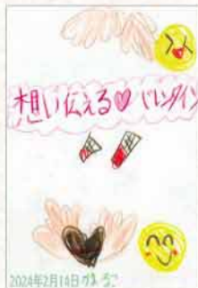
絵てがみ 岩手県 高橋香子(小学生)