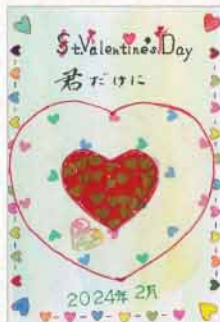
クラフトはがき 北海道 菅原勇