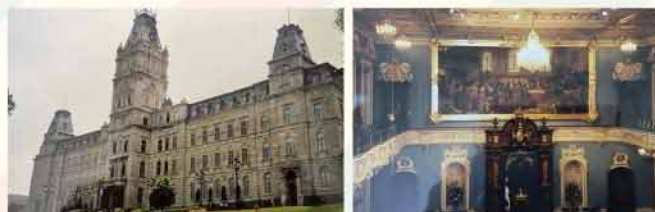
左:ケベック州議事堂/右:ケベック州議事堂内部