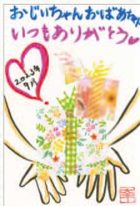
クラフトはがき 愛知県 本巢幸恵