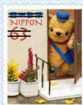
星山デザイナーの苦勞がかわいさの後ろに隠れている。

星山 新型コロナの制限がひと段落し再び旅行ができる喜びと、デザイナーが変わり、ぼすくまも新たな旅立ちの時を迎えたことから「旅するぼすくま」をコンセプトとしています。許諾不要な撮影場所など、ほぼないことを初めて知りました。自分で撮影場所を探し許諾などの手続きを取るにあたっては、撮影日の調整がとても大変でした。特にお天気が読めず、悩ましく思いました。撮影時は床に這いつくばり、ぼすくまを(文字通り)陰から支えています。