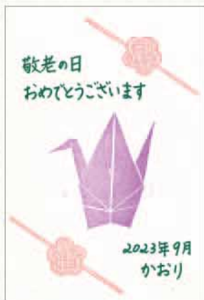
消しゴムはんこ 山口県 丸口かおり