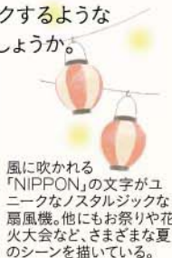
風に吹かれる「NIPPON」の文字がユニークなノスタルジックな扇風機。他にもお祭りや花火大会など、さまざまな夏のシーンを描いている。