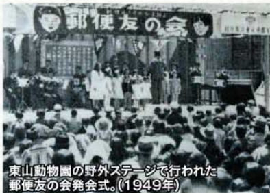
東山動物園の野外ステージで行われた郵便友の会発会式。(1949年)

1949年(昭和24年)の6月5日、愛知県名古屋市の東山動物園で「国内はもちろん外国にも友だちを求めて、友愛の世界を築こう!」と呼びかけて、青少年ペンフレンドクラブ(PFC)の前身である「郵便友の会」が誕生しました。PFC東海地方連合では、本年6月24日に発祥記念イベントの開催を予定しています。