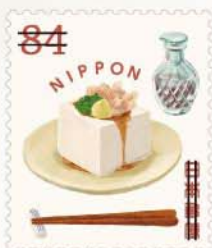
薬味がたっぷりのった王道の冷奴。

吉川 日本の夏をテーマに63円シートには屋外の楽しいモチーフを、84円シートには屋内の清涼感があるモチーフを選び描いています。夏のちょっとした楽しさや喜びを添えてお手紙を出して欲しいと思い制作しています。過去に発行した夏のグリーティングもさまざまなモチーフやテーマがありますが、2023年版は身近な夏を掘り下げて、冷奴など今までにあまり登場しなかったモチーフも選びました。