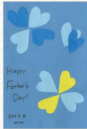
クラフトはがき 愛知県 丸山三奈