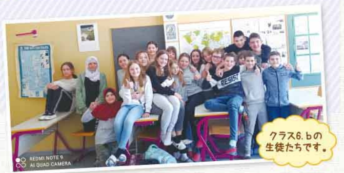
クラス6, bの生徒たちです。

新型コロナウイルスなどの影響で、国際郵便の郵便物送達に大きな影響が出ています。詳しくは日本郵便のWebサイトよりご確認ください。