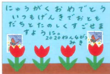
新入学 長野県 内堀美紀 折り紙の花に古切手の蝶が添えられています。