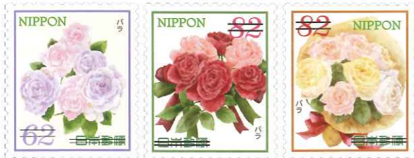
中丸デザイナーが担当する「おもてなしの花シリーズ」にも毎回バラが描かれる。左から「第10集(2018年4月)」「第11集(2018年12月)」「第12集(2019年4月)」。

中丸 以前から花屋さんやステーションナリーでも一番の売れ筋であるバラを取り上げた切手を企画していたのですが、今回「グリーティング(ライフ・花)」の担当になった事で、ついにバラだけの切手が発売されました。