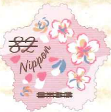
2019年2月発行「春のグリーティング」

2020年発行予定の「春のグリーティング」は、モチーフ案を一般の方から募集し、そのアイデアをもとに吉川デザイナーが「春のグリーティング」切手をデザインします。切手のアイデア募集は日本郵便株式会社初の試み。現在はWebサイトにて制作中の様子を公開しています。2020年2月下旬の発行をお楽しみに! ※アイデアの募集は終了しました。