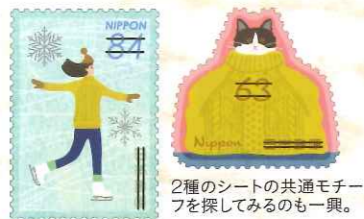
2種のシートの共通モチーフを探してみるのも一興。

吉川 寒い冬を「楽しく過ごす」をコンセプトに温かい部屋の中と雪の積もった外での楽しみを表現しています。一見別々の物語のように見える63円と84円のシートですが、実は編み物をして作ったセーターや小物を外遊びする人々が身に着けていたり、暖炉の部屋＝山小屋が描かれている等、隠れた物語のある切手としてデザインしました。