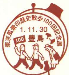
100回展小型印(申請原図)

100回記念展は11月29日(金)~12月1日(日)、目白・切手の博物館で開催。小型印を押すと1枚の絵になるフレーム切手や押印台紙も販売。スタンプラリー、風景印プレゼントやトークショーの他、散歩メンバーによるワークショップや郵趣品販売の多彩なブースも日替わりで15店以上開設。3日間で全ブースを制覇してください!